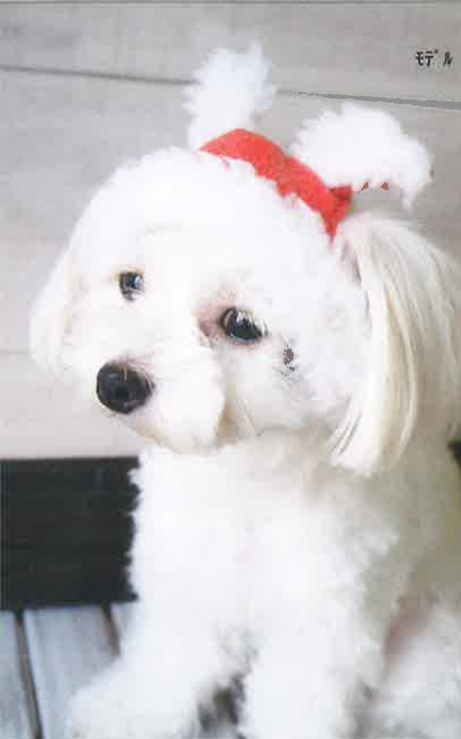
モデル 約 2.5kg XS 着用